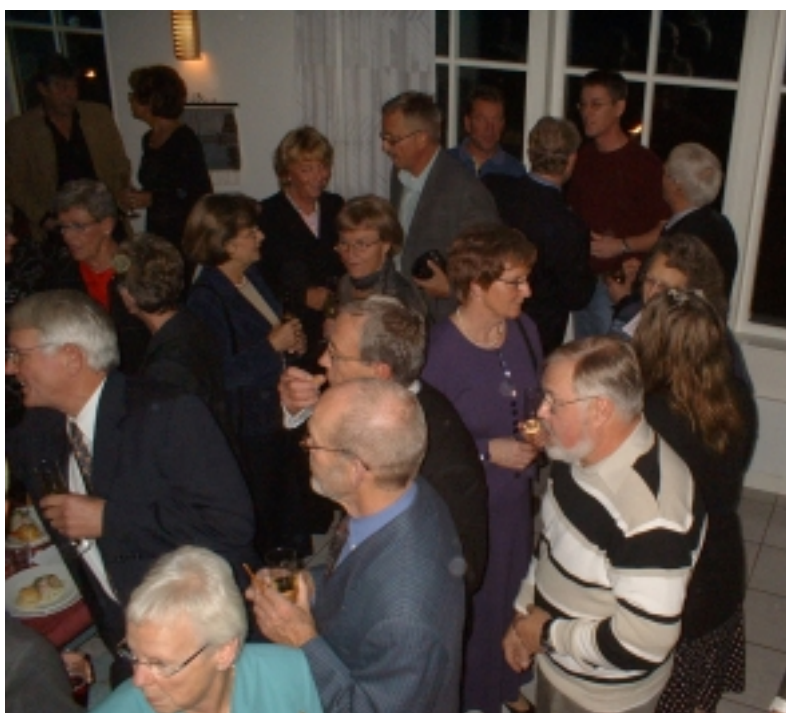
Samling före maten