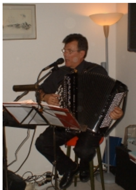
Enmansorkestern, mycket uppskattad