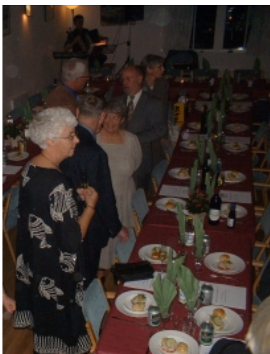
Samling före maten