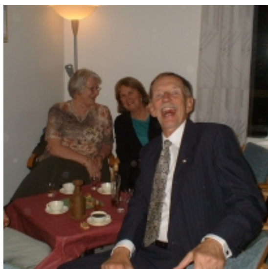
Festkommittén gläds åt att festen blivit lyckad