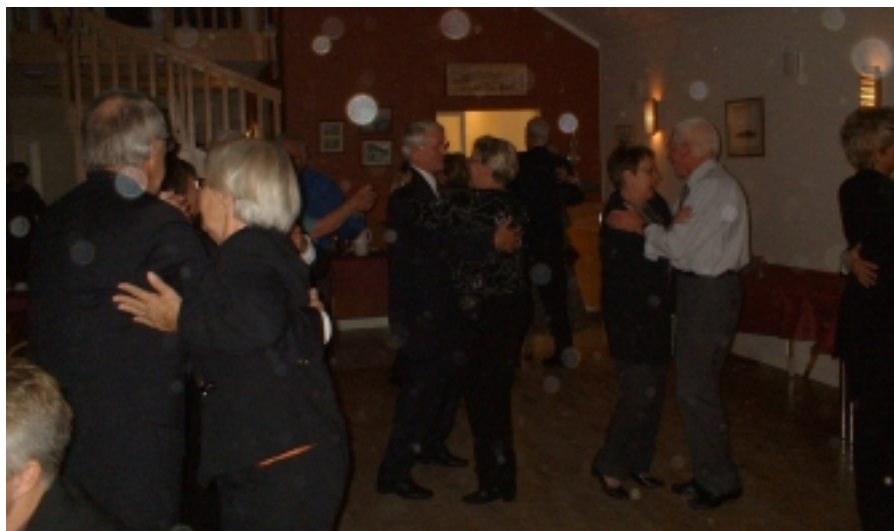
I dansens virvlar