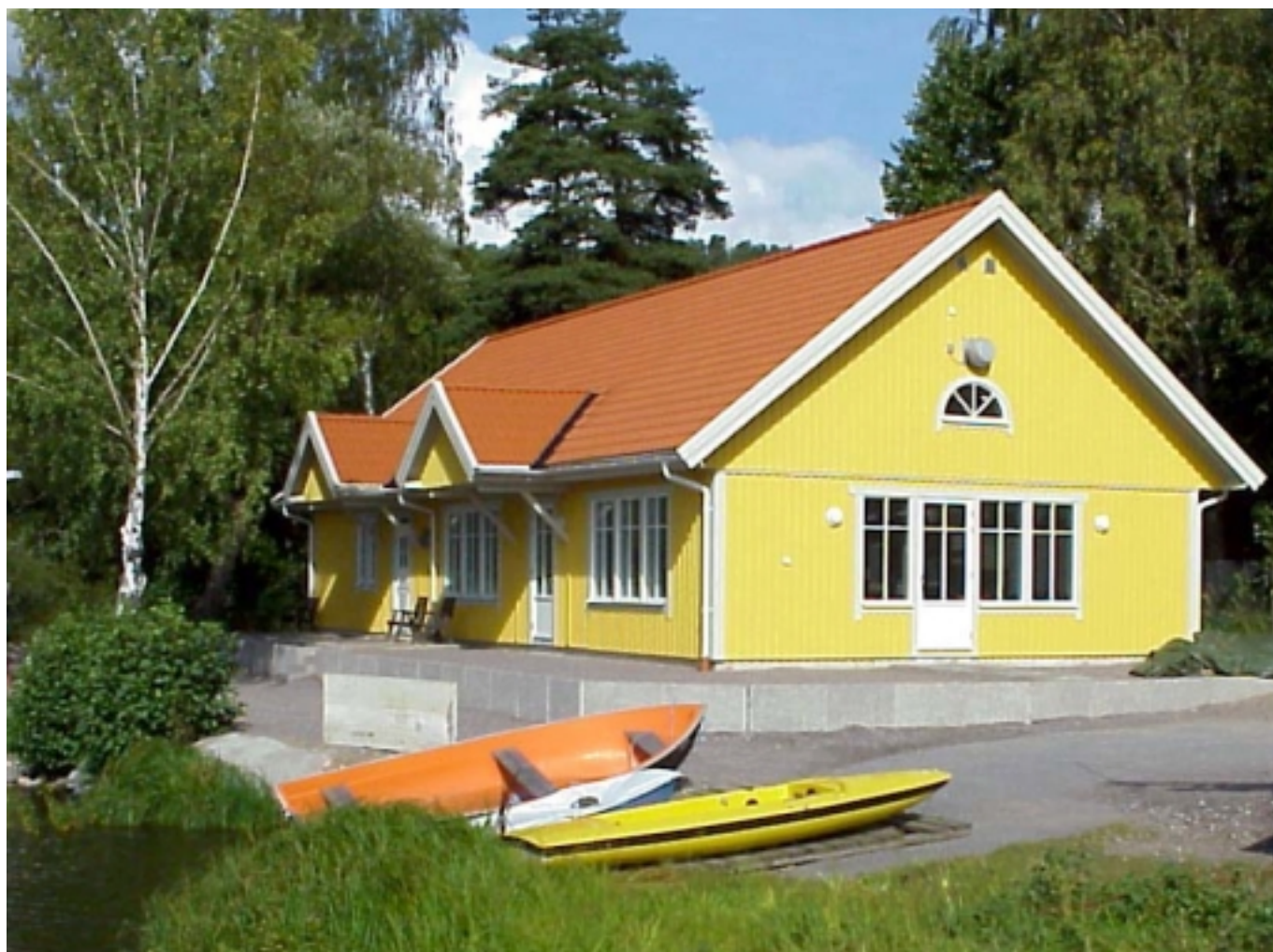
Klubbhuset kompassen innan altanen färdigställts!