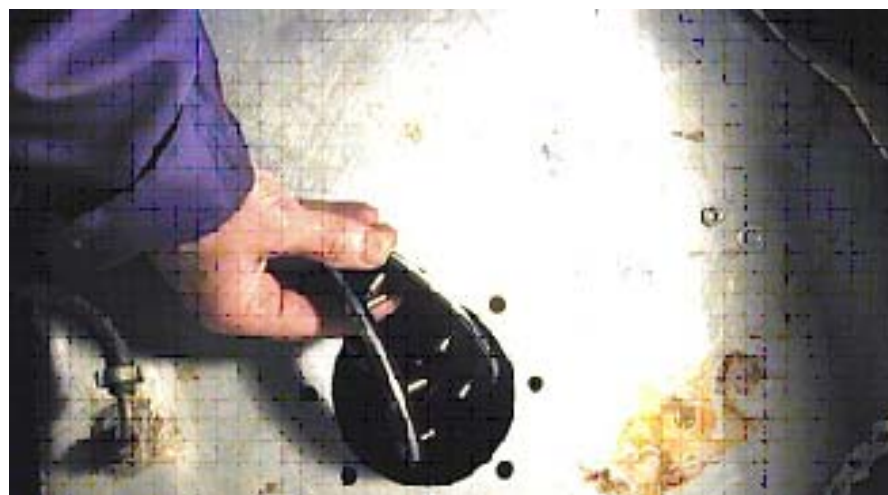
Vik ihop och passa in underdelen