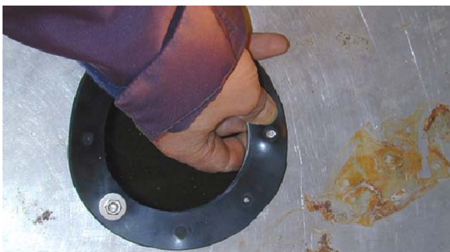
På med gummipackningen och lås underdelen.