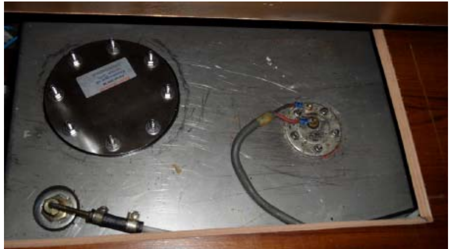
Monterad och klar