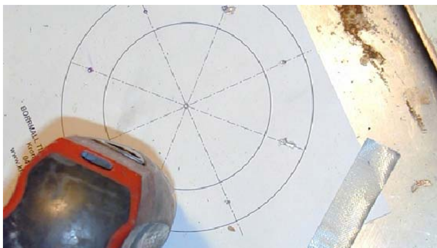
Mät, borra, såga

Ett tips för monteringen är att istället för en stor hålsåg (som är dyr om man inte redan har den) är att använda en vanlig sticksåg. Jag provade först