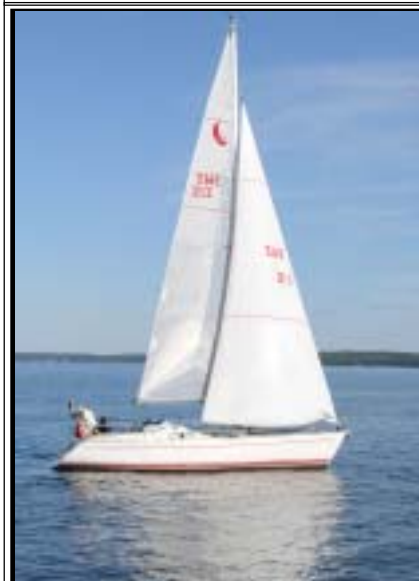
Urban Sandh Confortima 35