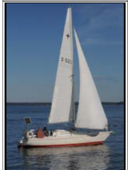
Kejo Albin Cumulus