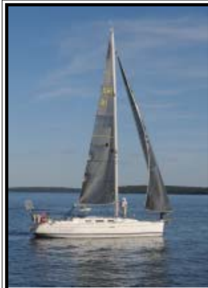
Bubbel med Rollanders Dufour 40