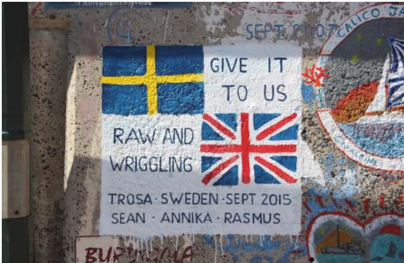
RAW tavla Porto Santo

båtar från OSK som har besökt ön, även några kvar från 90-talet. Naturligtvis var vi tvunga att lämna vårt eget spår.