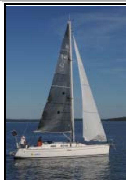
Sol Cidahn Dufour 34