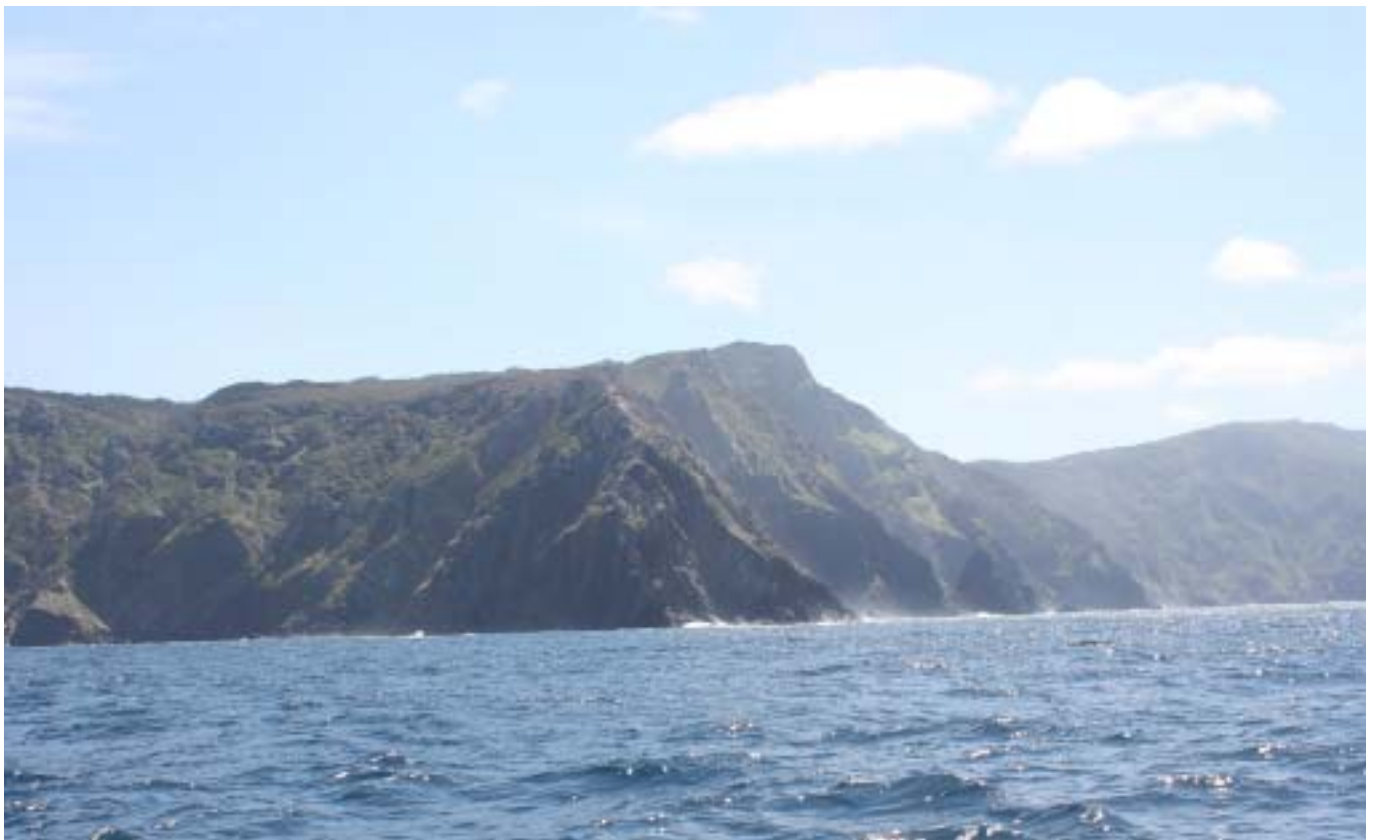
Costa da Morte

Vi tillbringade över en månad i dessa vatten och kunde verkligen njuta av seglingen i, för oss, nya och exotiska platser. Det är naturligtvis många båtar som cruisar detta område, de allra flesta från Frankrike (som ligger närmast) och Norge, vi har regulbundet umgåtts med andra cruisers, dock sällan svenskar som vi inte sett så många av. Vi gjorde