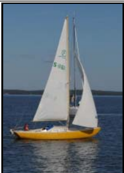
Stefan Liljeborg IF