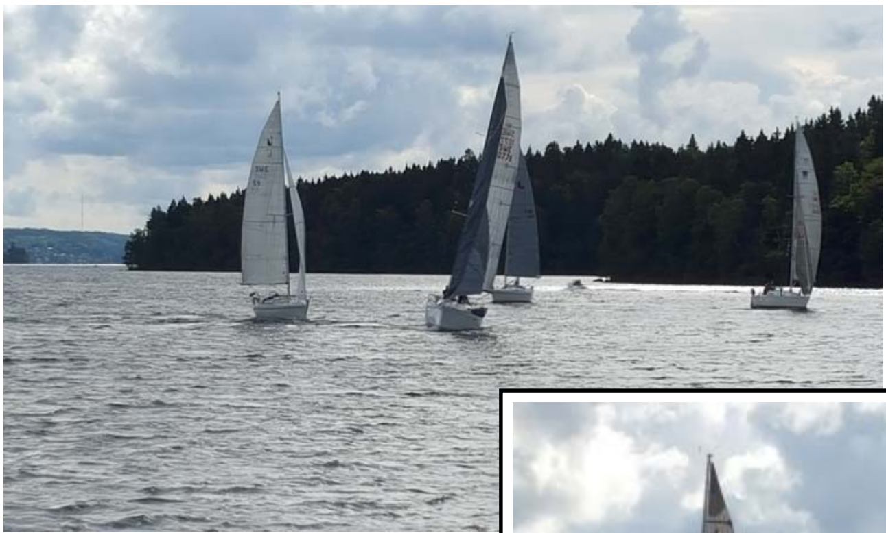
Starten i årets "Tvådagars"