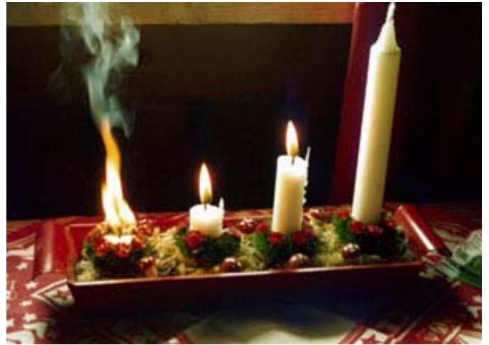
Glöm inte bort ljusen...

Stort tack till alla som varit delaktiga i allt arbete som utförts i klubben under året. Naturligtvis så har mycket annat gjorts som inte nämnts här.